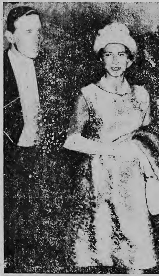
Nan a aparece na publico trobe. Pa cumpli cu nan obligacionnan di nan puesto, Prinses Margareth i su esposo Anthony Armstrong—Jones nan prome bishita publico-foi despues cu nan a regresa di Caribe na unda nan a bai pasan nan luna di miel. Nos ta mira nan aqui na un evenemento den Earl's Court na London.

Gobierno di Alemania oriental ta bisa cu e potencionnan occidental no a respecta e acuerdonan di Potsdam, particularmente e stipulacionnan tocante extermnacion di Nacional-socialismo y militarismo na Alemania.